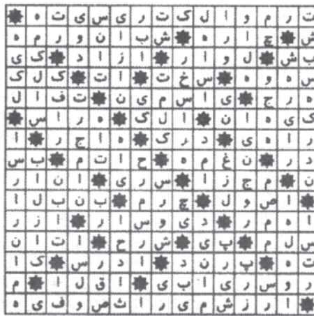
حل جدول ۳۹۳۳