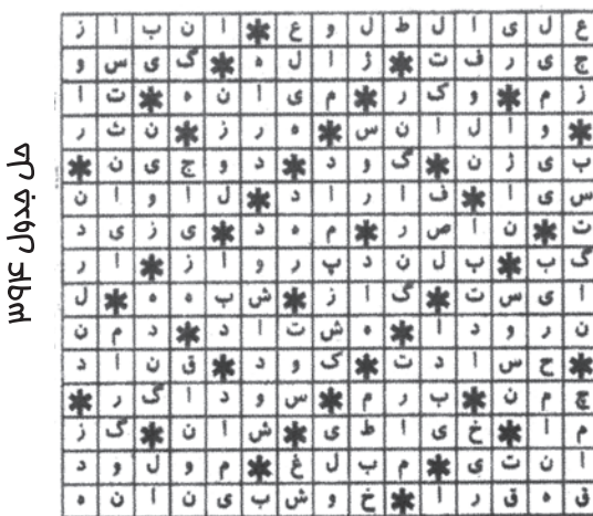
حل جدول عمودی