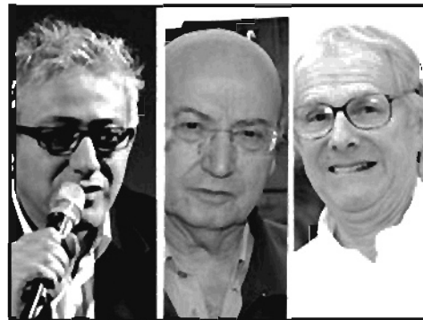
کن لوچ - تئو آنجلوپولوس - ایلیا سلیمان

ایران که به دلایل امنیتی از بردن نام آن‌ها خودداری شده است با انتشار نامه‌ای از سینماگران خارجی خواسته بودند تا در اعتراض به برخوردهای دولت ایران یا مردم از شرکت در جشنواره فیلم فجر خودداری کنند.