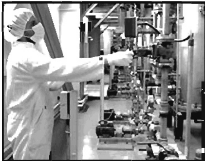
تصویری از سایت هسته‌ای ایران

غنی‌سازی اورانیوم در آستانه نظامی شدن برنامه اتمی ایران است.