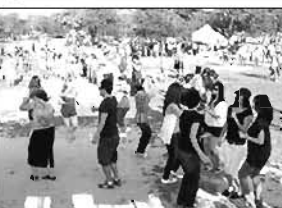
با سپاس فراوان برای مکس های گرفته شده از هوایما مرحمتی آقای شان پناهی